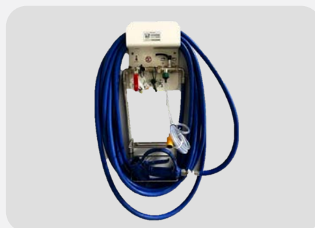
SAV CENTRALE 1 PRODUIT 15M PERSONNALISEE HEDIS