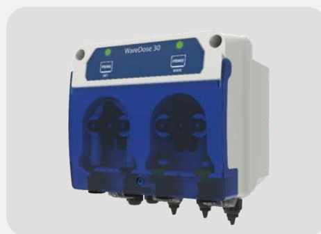
DOSEUR VAISSELLE LR WAREDOSE 30 KOMPACT