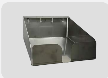
SUPPORT BAG 5L ET 10L Réf. : 570017