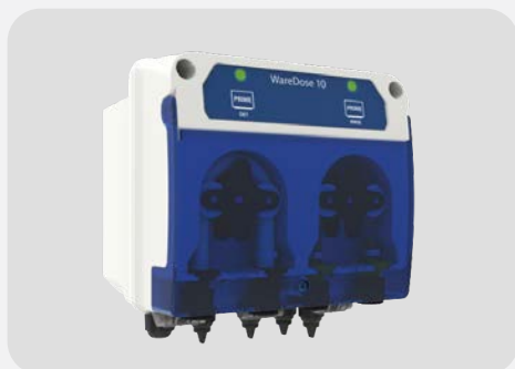
DOSEUR VAISSELLE LR WAREDOSE 10 KOMPACT HEDIS