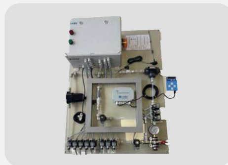
MULTIMACHINE 8 PDTS PR 5 EXTRA+PPE KNF+BOITIER ALARME+2DEBIMETRES