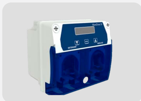
DOSEUR LAVAGE ET RINCAGE WAREDOSE 35 VS PRESS