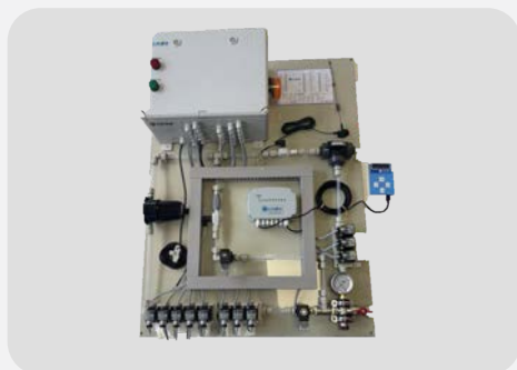
MULTIMACHINE 8 PDTS PR 3 EXTRA+PPE KNF+BOITIER ALARME+2DEBIMETRES